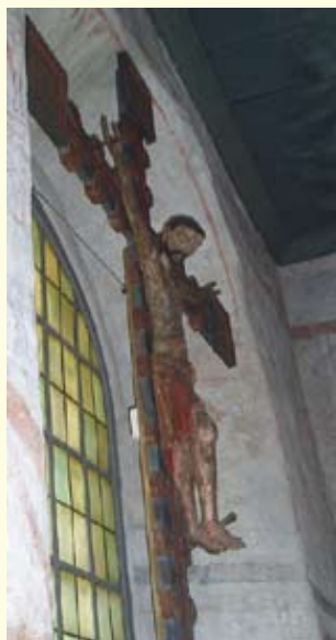
Jesus Kristus, Guds Son, förbarma dig över mig. Krucifix i Dörrarps kyrka.

Gud, du är med oss i dagens verksamhet, men du är också med oss i nattens tystnad och ro. Låt våra trötta kroppar finna vila i en god sömn och låt våra själar få förnyad kraft till morgondagens arbete och sysslor.