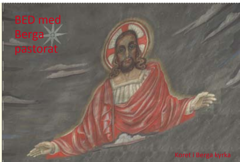
Koret i Berga kyrka

Jesus säger: Kom till mig alla ni som är tyngda av bördor; jag ska skänka er vila (Matt 11:28)