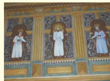
Del av orgelläktaren i Vittaryds kyrka.

Gud, kom till min räddning. Herre skynda till min hjälp. Ära vare Fadern och Sonen och den helige Ande Nu och alltid och i evigheters evighet. Amen