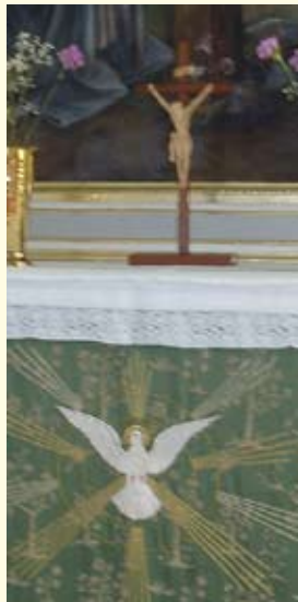
Altaret i Bolmsö kyrka.

Fader vår som är i himlen Helgat vare ditt namn Tillkomme ditt rike Ske din vilja såsom i himmelen så ock på jorden Vårt dagliga bröd giv oss idag Och förlåt oss våra skulder såsom ock vi förlåter dem oss skyldiga äro Och inled oss inte i frestelse Utan fräls oss ifrån ondo. Ty riket är ditt och makten och härligheten i evighet, Amen