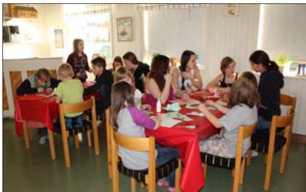
Aktiviteter inför Alla hjärtans dag i måndagsgruppen.

Vi har även startat en medverkar-tävling i ungdomsgruppen. Under vårterminen kommer det finnas olika tillfällen då ungdomarna kan medverka och hjälpa till på olika sätt i verksamheterna. De olika tillfällena kommer ge poäng och den med flest poäng kommer i slutet av terminen att få ett pris. Detta är en frivillig tävling och ett sätt för ungdomarna att vara med och se hur andra delar av kyrkan fungerar.